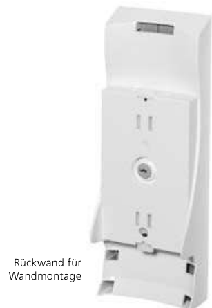
Rückwand für Wandmontage